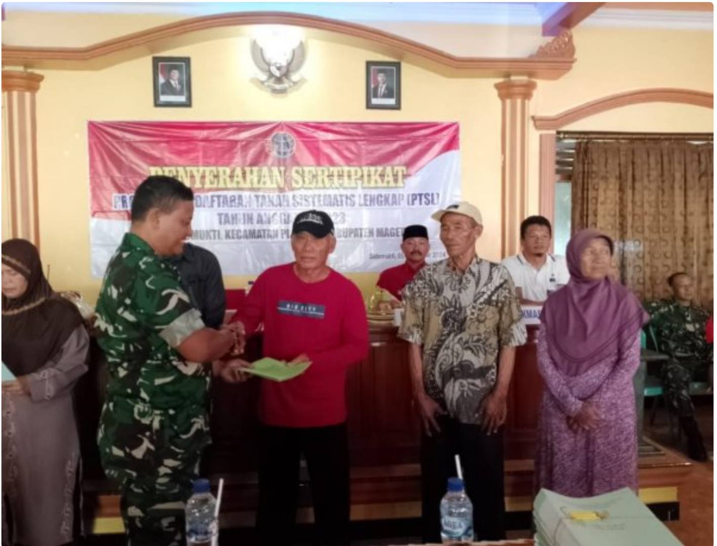
Danramil 0804/02 Plaosan Hadiri Penyerahan Sertifikat Program Pendaftaran Tanah Sistematis Lengkap (PTSL) Desa Sidomukti

PLAOSAN. - Desa Sidomukti melalui Badan Pertanahan Nasional (BPN) melakukan penyerahan Sertifikat Tanah Program Pendaftaran Tanah Sistematis